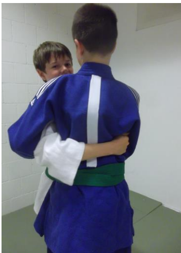
figure 3 permise

Les prises permises qui passent par la colonne vertébrale, mais qui passent sous le bras. (Voir figures 3-4)