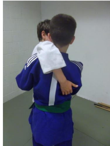
figure 6 interdite