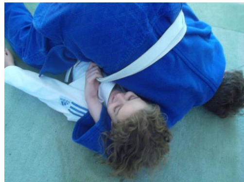
figure 8 interdite