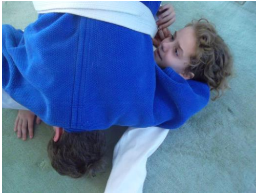
figure 9 interdite