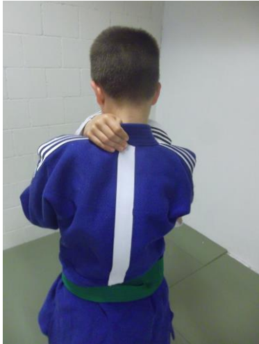
figure 1 permise