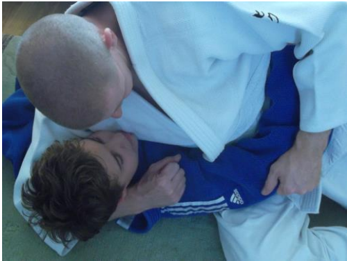
figure 7 interdite

Prise en boucle lors de Tatae-Shiho-Gatame ou de Yoko-Shiho-Gatame.