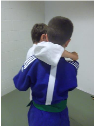
figure 5 interdite