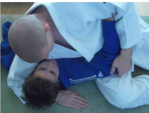
figure 10 permise