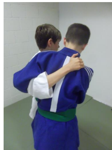
figure 4 permise

Les prises interdites lors desquelles il existe des risques de blessures pour le cou, la nuque ou la colonne vertébrale.